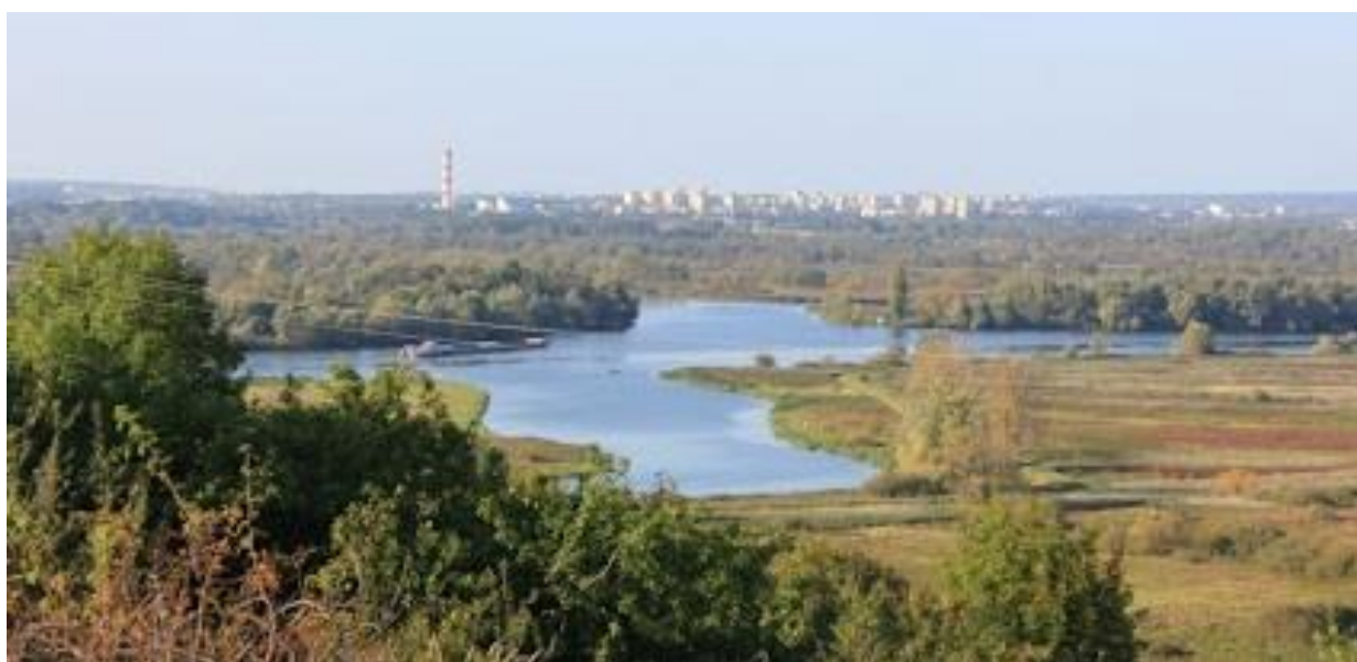
fot.: widok ze Wzgórza Bombardierów

17.03.2023 r. (niedziela) – Puszcza Bukowa