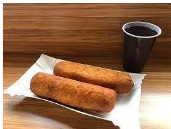
Fot. wycinek z pracy szczecińskiej dot. otwarcia pierwszej „Paszteciarni”

Historia pasztecika szczecińskiego sięga 1969 roku, kiedy to w spółdzielni spożywców "Społem" zrodził się pomysł wykorzystania radzieckiej maszyny do przygotowywania "pirożków". Pierwszy w Polsce i w Szczecinie punkt powstał przy alei Wojska Polskiego 11 (naprzeciwko kina Kosmos).