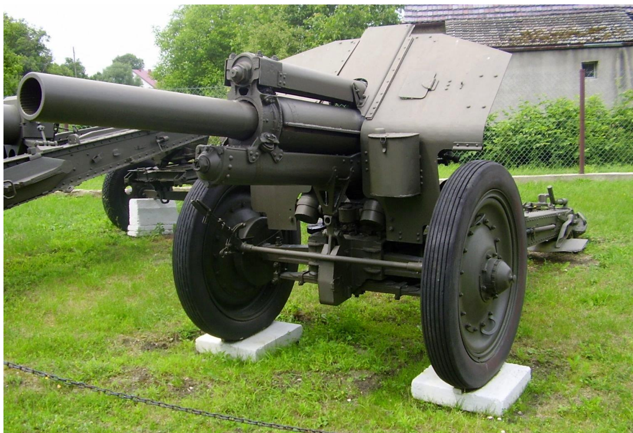
122 mm haubica wz. 1938 (M-30) ; (źródło : Wikipedia)