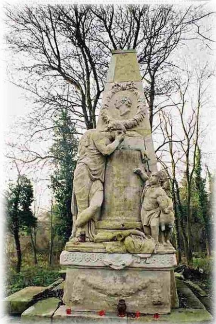
Nagrobek Jurgena von Ramin w Stolcu

Trasa: Tanowo - ruiny dworu Raminów (Gunice) - cmentarzyk Raminów - Węgornik - jez. Świdwie - Bolków - Stolec (pałac, kościół i pomnik na cmentarzu przykościelnym). Długość trasy: około 15 km.