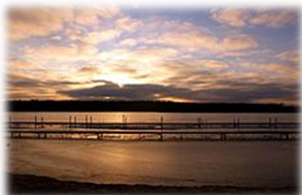
Fot. Jezioro Pamiątkowskie

Zbiórka uczestników dworzec PKP Szczecin Główny godz. 5.45 (odjazd pociągu o godz. 6.00 ). Odjazd z Pamiątkowa o godz. 16.47 , przyjazd do Szczecina Głównego o godz. 19.23 .