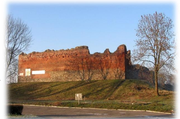
Ruiny zamku Drahim