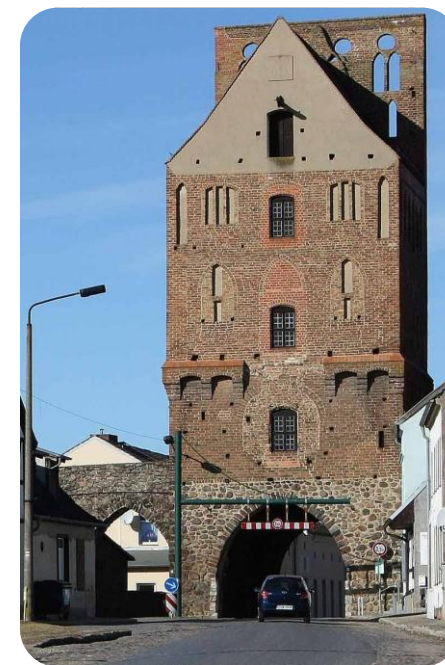
Fot.: Brama Szczecińska w Gartz (Internet)